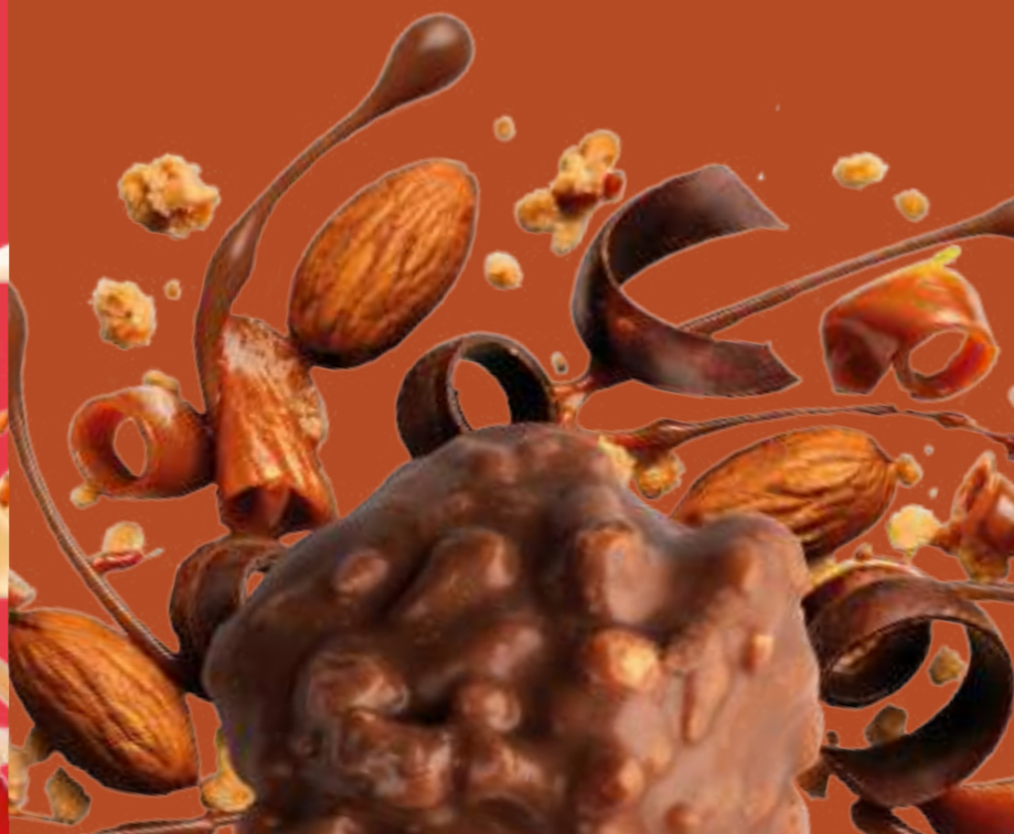
CLUSTER AL CIOCCOLATO AL LATTE CON MAIS TOSTATO CAMELLATO E MANDORLE