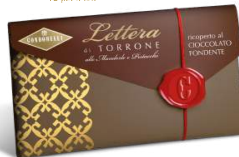
Lettera di torrone morbido ricoperto al cioccolato fondente. Soft nougat block covered with dark chocolate flavoured coating.

cod. 10160 100 g cod. EAN 8004494319022 cm 18,5 x 9 x 1,5 h 12 pz. x crt.