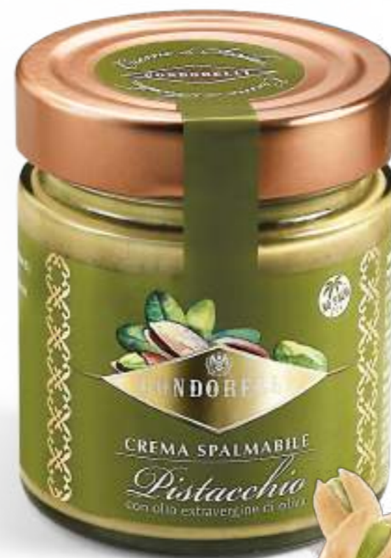
Vasetto di crema ai pistacchi di Sicilia. Jar of Sicilian pistachio cream.