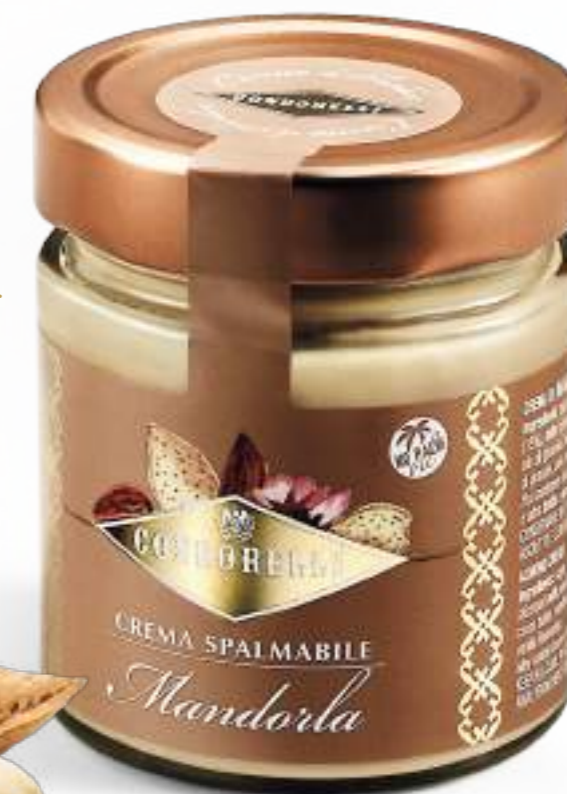
Vasetto di crema alle mandorle di Sicilia. Jar of Sicilian almond cream.