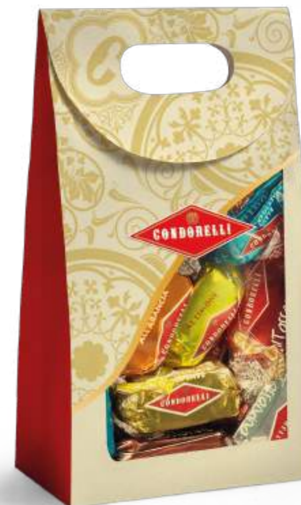
Shopper per sfuso Shoppers for bulk