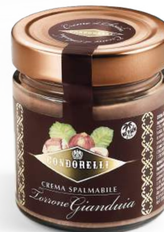
Vasetto di crema al Torrone Gianduja. Jar of Gianduja nougat cream.