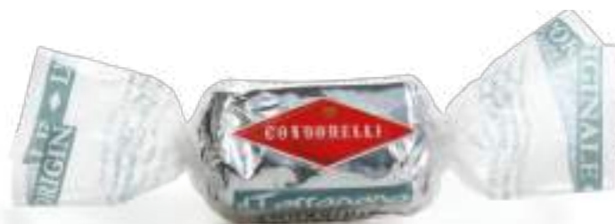
Vaniglia / Vanilla