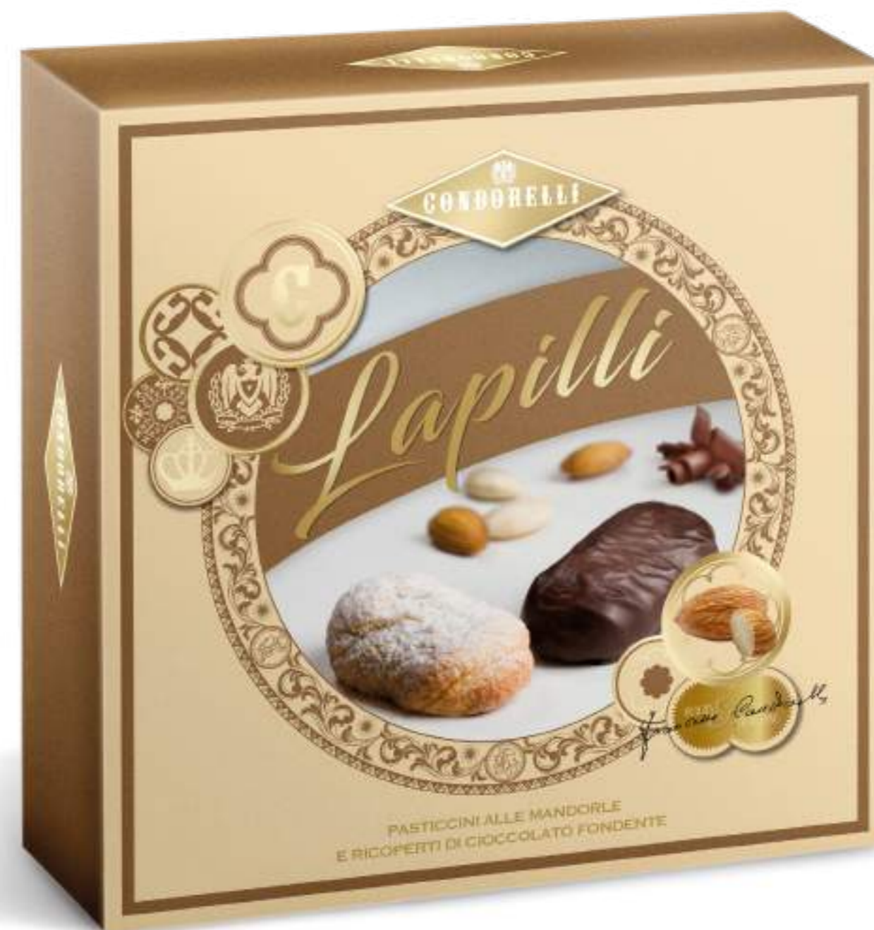
Pasticcini alle mandorle e alle mandorle ricoperti al cioccolato fondente.

Almonds pastries and almonds pastries coated in dark chocolate.