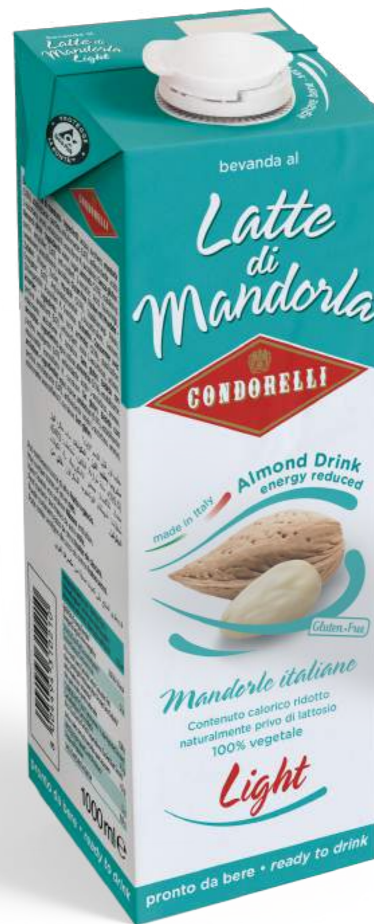
Latte di Mandorla Light Almond drink - energy reduced 1000 ml