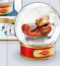
Pz 2 Confezione con oggetto regalo Winter Ball + 200 g Torroncini Assortiti Packaging with "Winter Ball" gift item + 200 g soft assorted nougat sweets