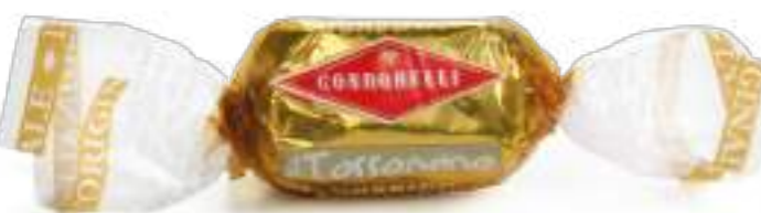
Cioccolato fondente Dark chocolate