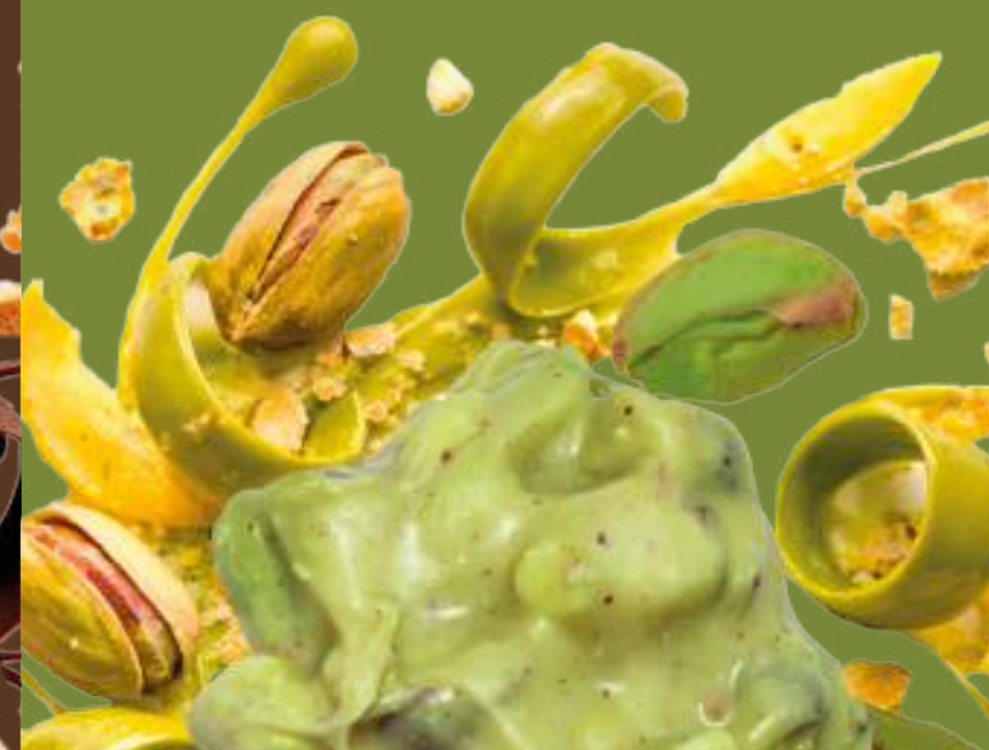
CLUSTER AL CIOCCOLATO AL PISTACCHIO CON LIMONE E GRANELLA DI PISTACCHI