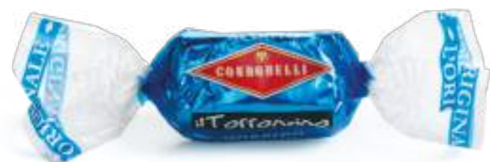
Cioccolato al latte Milk chocolate