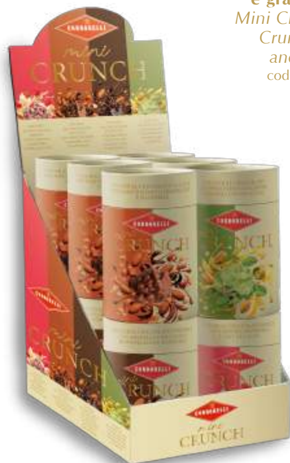
Espositore Counter display N° 12 confezioni cilindro (4 soggetti x 3 pezzi) No. 12 tin packs (4 subjects x 3 pieces) 130 g cad. cod. 24121 cod. EAN 8004494320660 cm 20 x 26 x 36 h 1 pz. x crt.