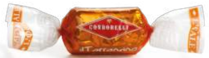
Arancia / Orange