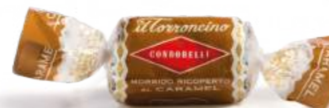
Caramel salato Salted caramel