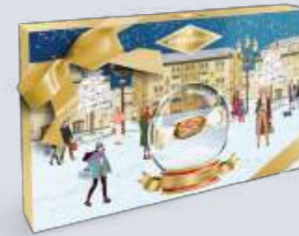
Pz 2 Confezione regalo 450 g Packaging 450 g