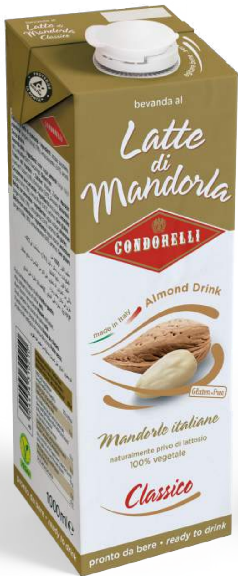
Latte di Mandorla Classico Almond drink 1000 ml