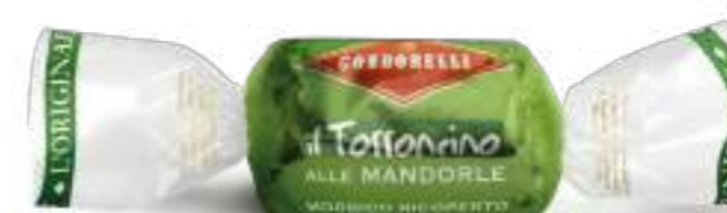
Ricoperto al pistacchio Pistachio coated