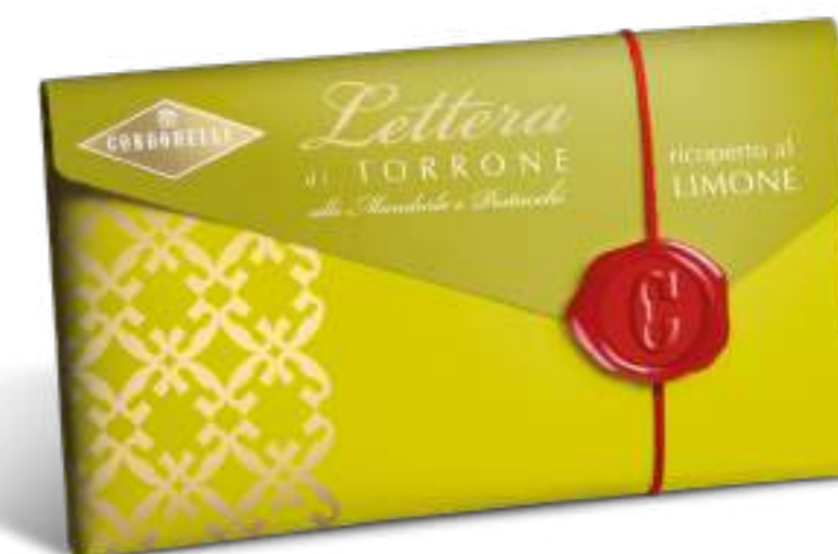
Lettera di torrone morbido ricoperto al limone. Soft nougat block covered with lemon flavoured coating.

cod. 10161 100 g cod. EAN 8004494319039 cm 18,5 x 9 x 1,5 h 12 pz. x crt.