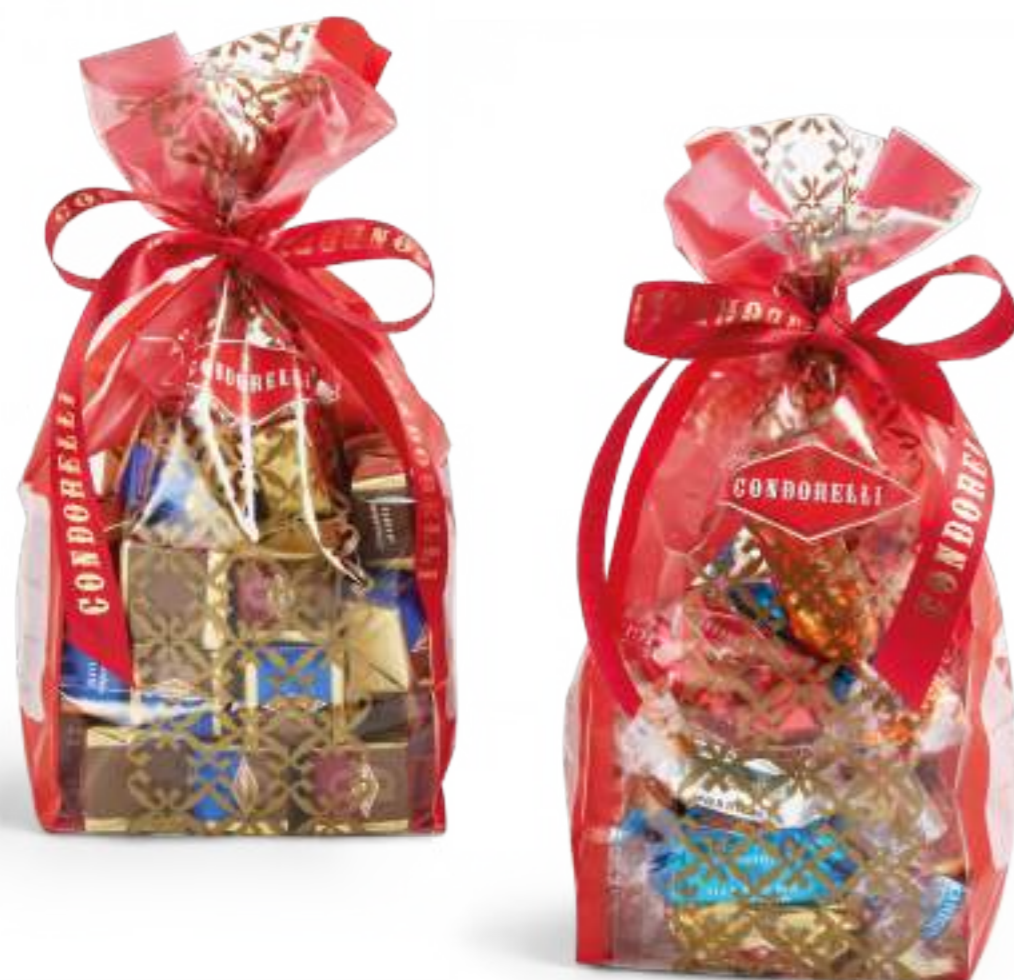
Sacchetto per sfuso Bulk bag