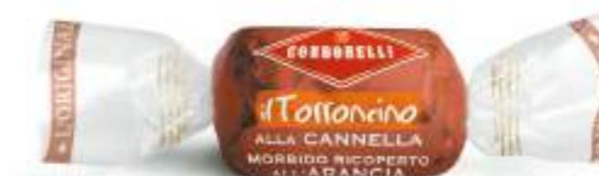
Cannella ricoperto all'arancia Orange coated cinnamon nougat sweet