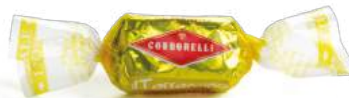
Limone / Lemon