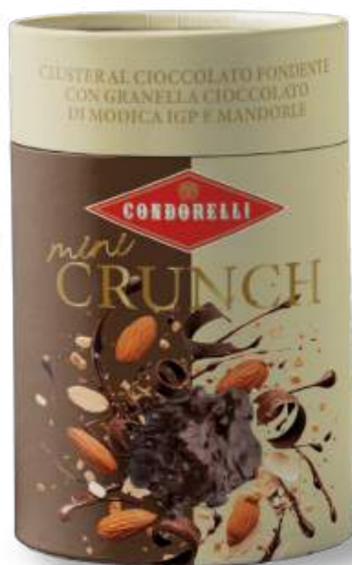
Mini Crunch al cioccolato fondente con granella di cioccolato di Modica IGP e mandorle. Dark Chocolate Mini Crunch with chocolate of Modica IGP chips and almonds. cod. EAN 8004494320677