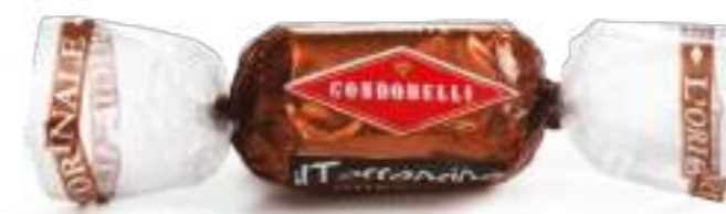
Caffè / Coffee