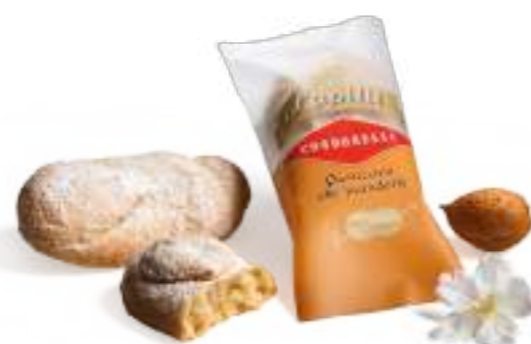
Pasticcini alle mandorle. Almonds pastries.