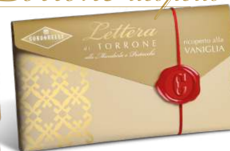
Lettera di torrone morbido ricoperto alla vaniglia. Soft nougat block covered with vanilla flavoured coating.

cod. 10162 100 g cod. EAN 8004494319046 cm 18,5 x 9 x 1,5 h 12 pz. x crt.