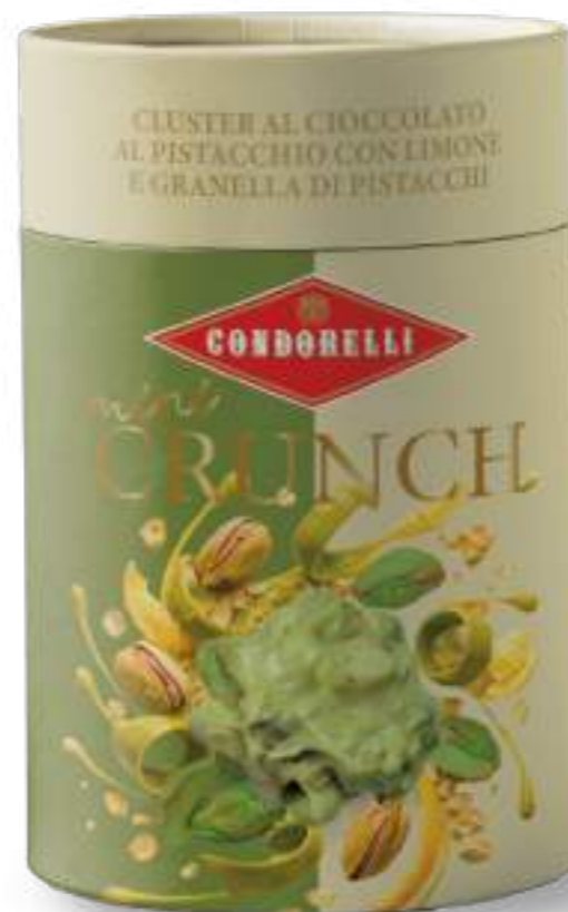
Mini Crunch al cioccolato al pistacchio con limone e granella di pistacchi. Mini Chocolate-Pistachio Crunch with pistachio and lemon sprinkles. cod. EAN 8004494320738