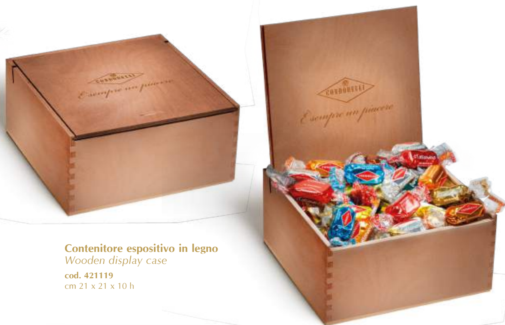
Contenitore espositivo in legno Wooden display case