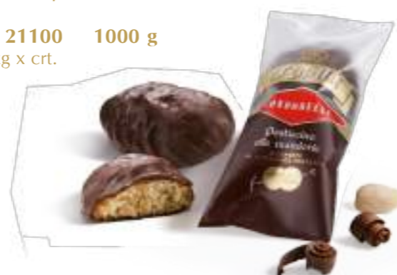
Pasticcini alle mandorle ricoperti al cioccolato fondente. Almonds pastries coated in dark chocolate.