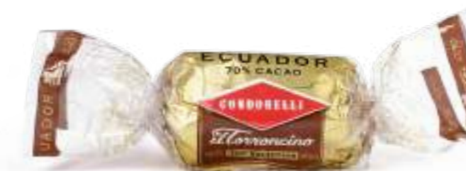
Ecuador 70% cacao Dark chocolate 70%