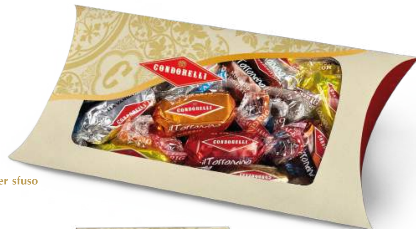
Astuccio per sfuso Bulk case