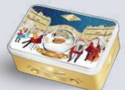
Pz 4 Confezione regalo in latta 200 g Tin gift box 200 g