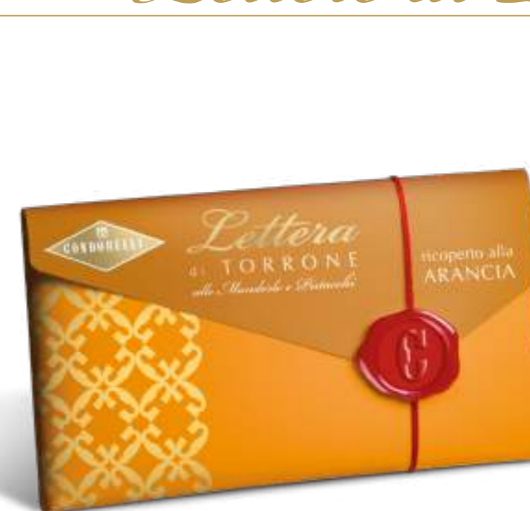
Lettera di torrone morbido ricoperto all'arancia. Soft nougat block covered with orange flavoured coating.

cod. 10165 100 g x 24 pz. cod. EAN 8004494318964 cm 21 x 20 x 57 h