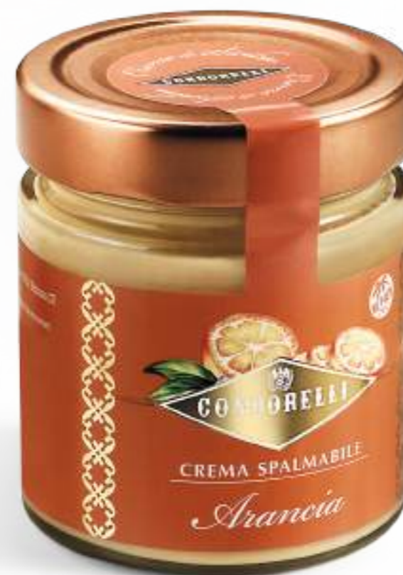
Vasetto di crema all'arancia. Jar of orange cream.