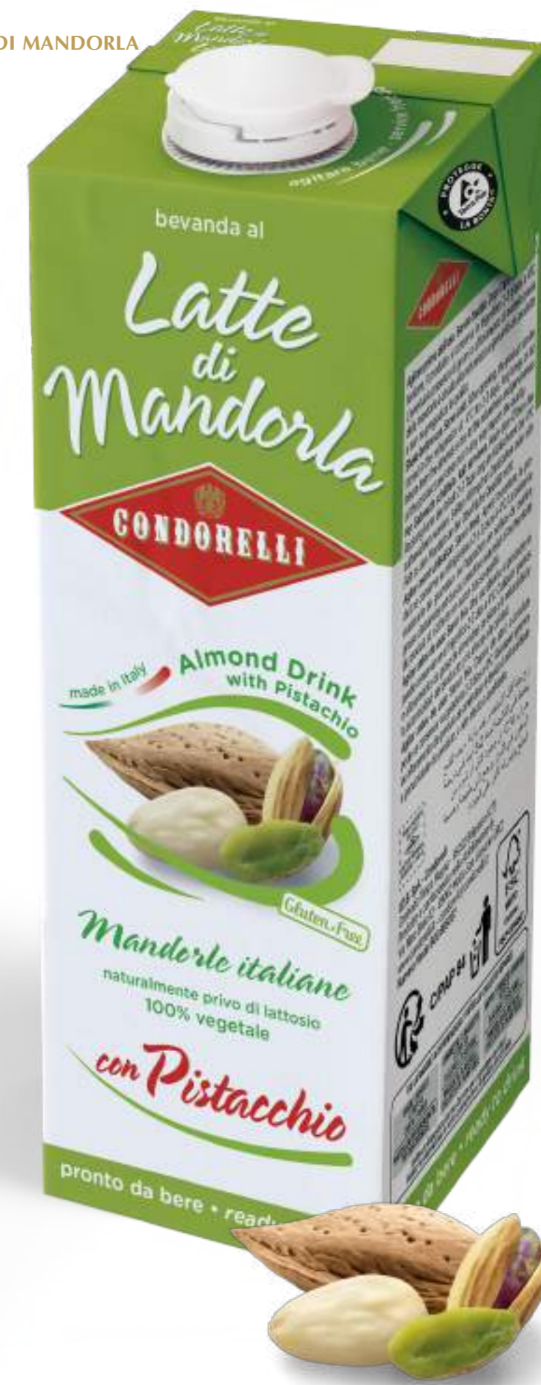
Latte di Mandorla con Pistacchio Almond drink with pistachio 1000 ml