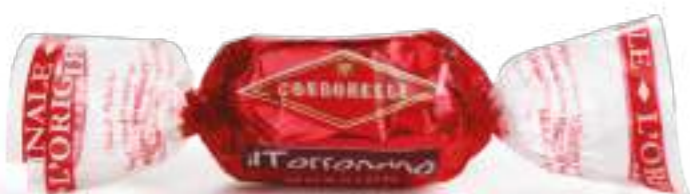
Gianduja / Gianduja