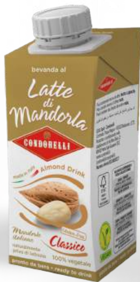
Latte di Mandorla Classico Almond drink 3 Brik - 200 ml