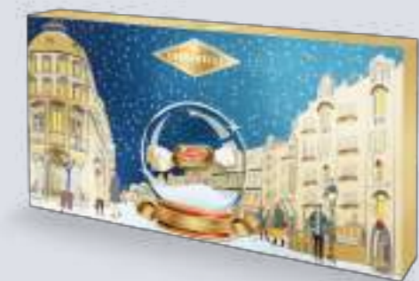
Pz 4 Confezione regalo 300 g Packaging 300 g