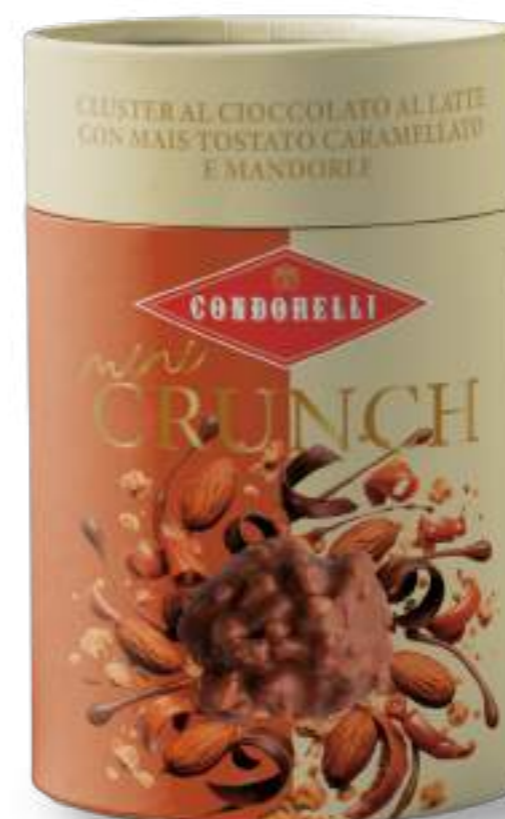
Mini Crunch al cioccolato al latte con mais tostato caramellato e mandorle. Milk Chocolate Mini Crunch with caramelized toasted corn and almonds. cod. EAN 8004494320745

Dimensioni confezione cilindro cm Ø 7,6 x 12,5 h