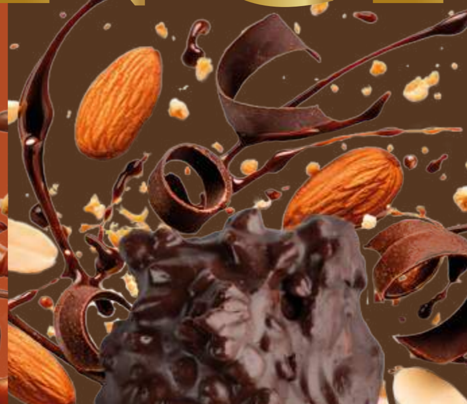
CLUSTER AL CIOCCOLATO FONDENTE CON GRANELLA CIOCCOLATO DI MODICA IGP E MANDORLE