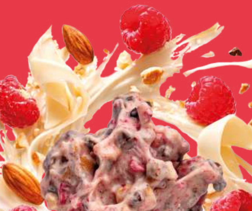
CLUSTER AL CIOCCOLATO BIANCO CON LAMPONI, MANDORLE E FAVE DI CACAO