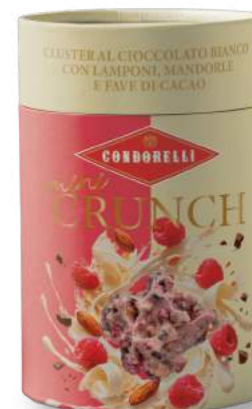
Mini Crunch al cioccolato bianco con lamponi, mandorle e fave di cacao. White Chocolate Mini Crunch with raspberries, almonds, and cocoa beans. cod. EAN 8004494320752