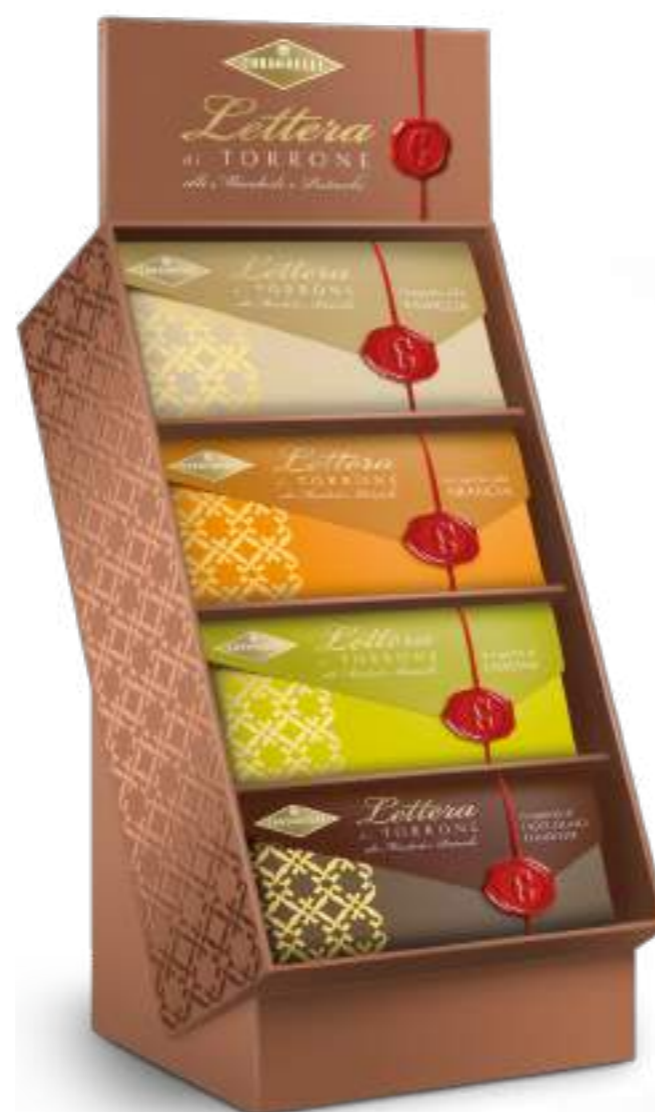
Espositore Counter display

cod. 10165 100 g x 24 pz. cod. EAN 8004494318964 cm 21 x 20 x 57 h